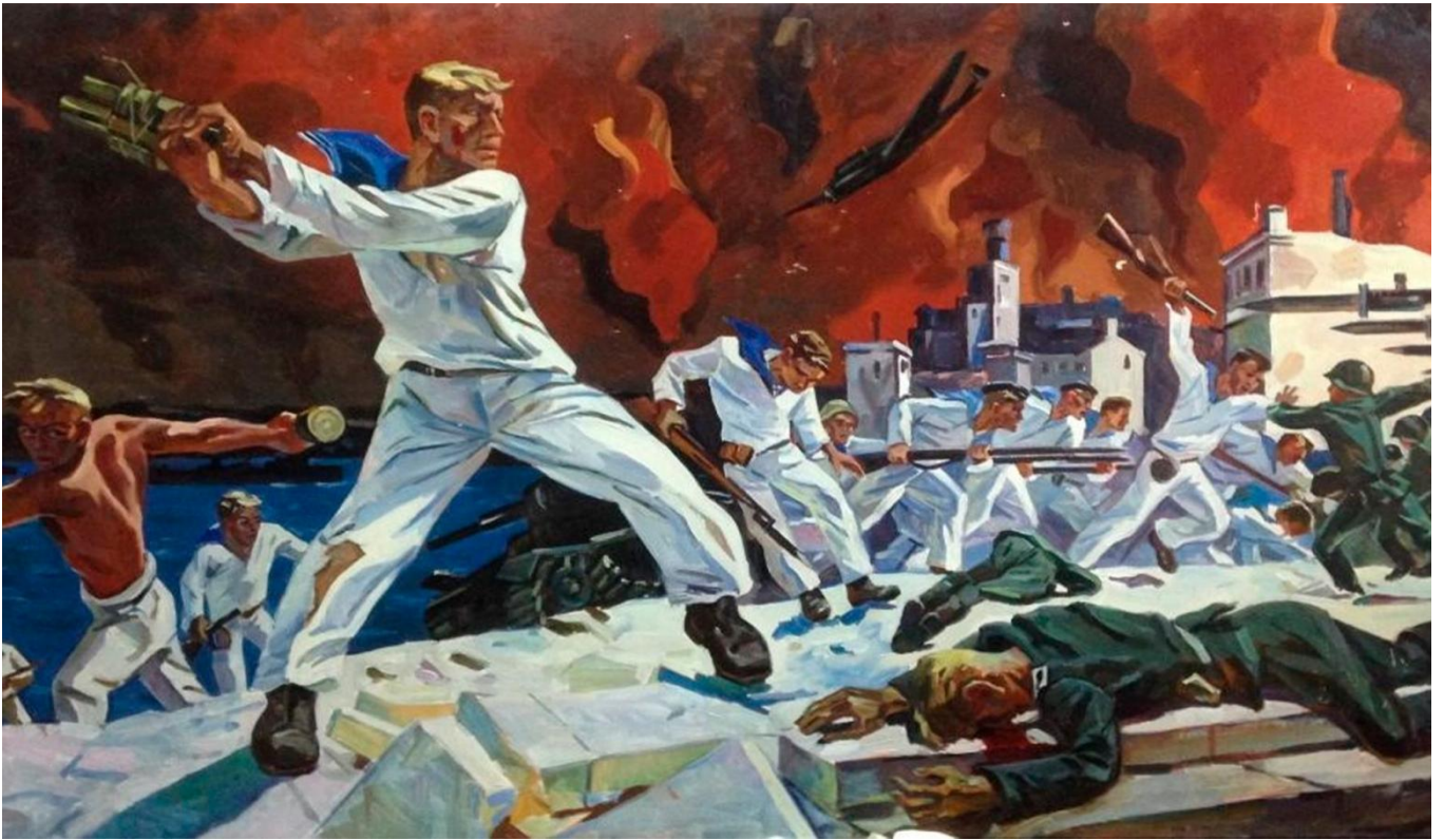
Ф. Рубо "Панорама обороны Севастополя"