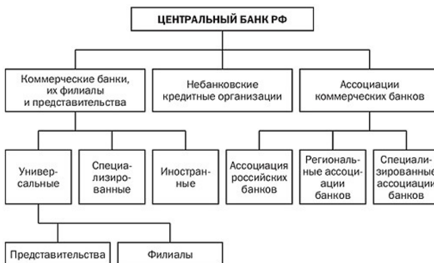
Рисунок 1 - Структура банковской системы Российской Федерации

Банковская деятельность является лицензируемым видом деятельности.